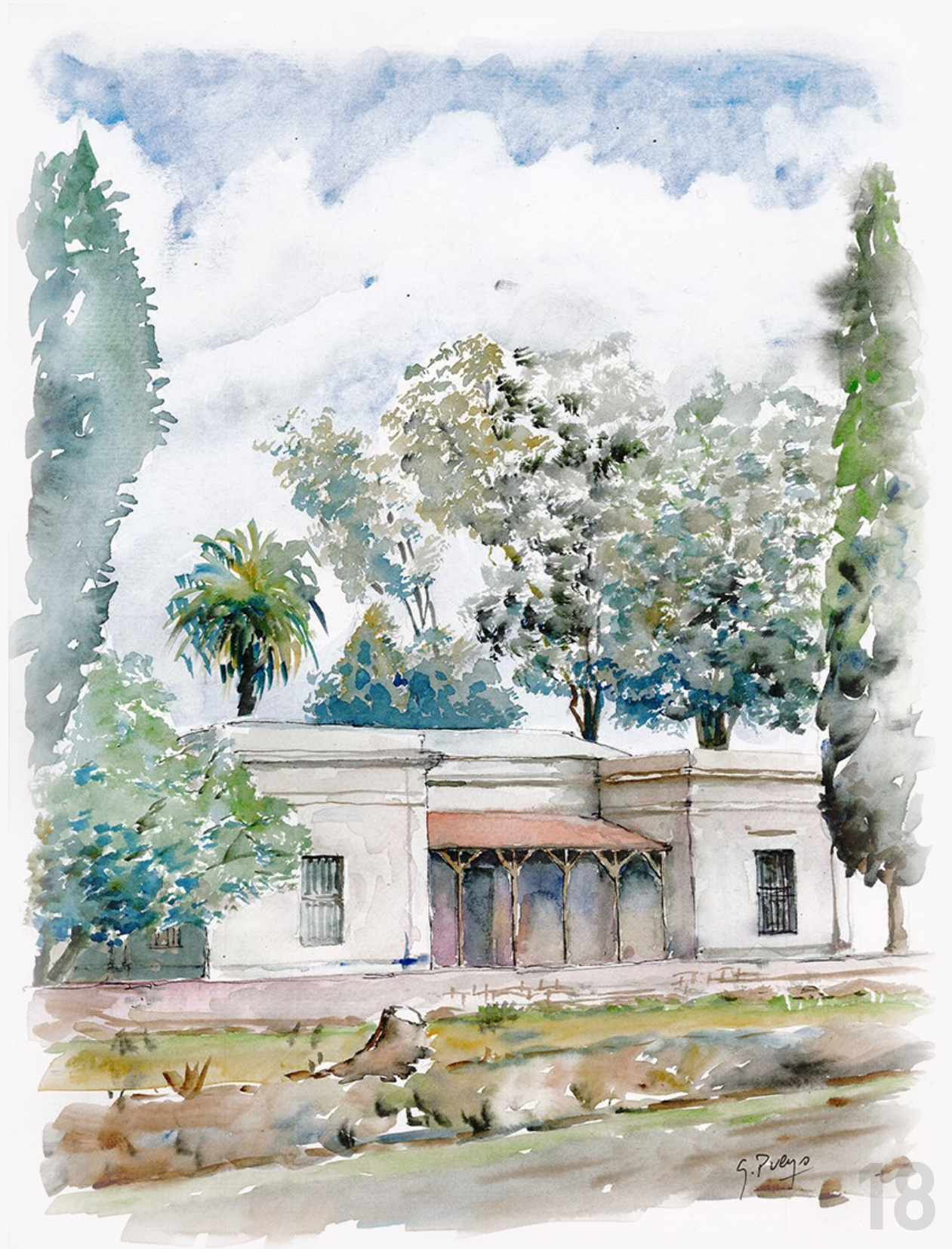
ORDENANZA N° 2750/18 Casa de Carlos Steigleder