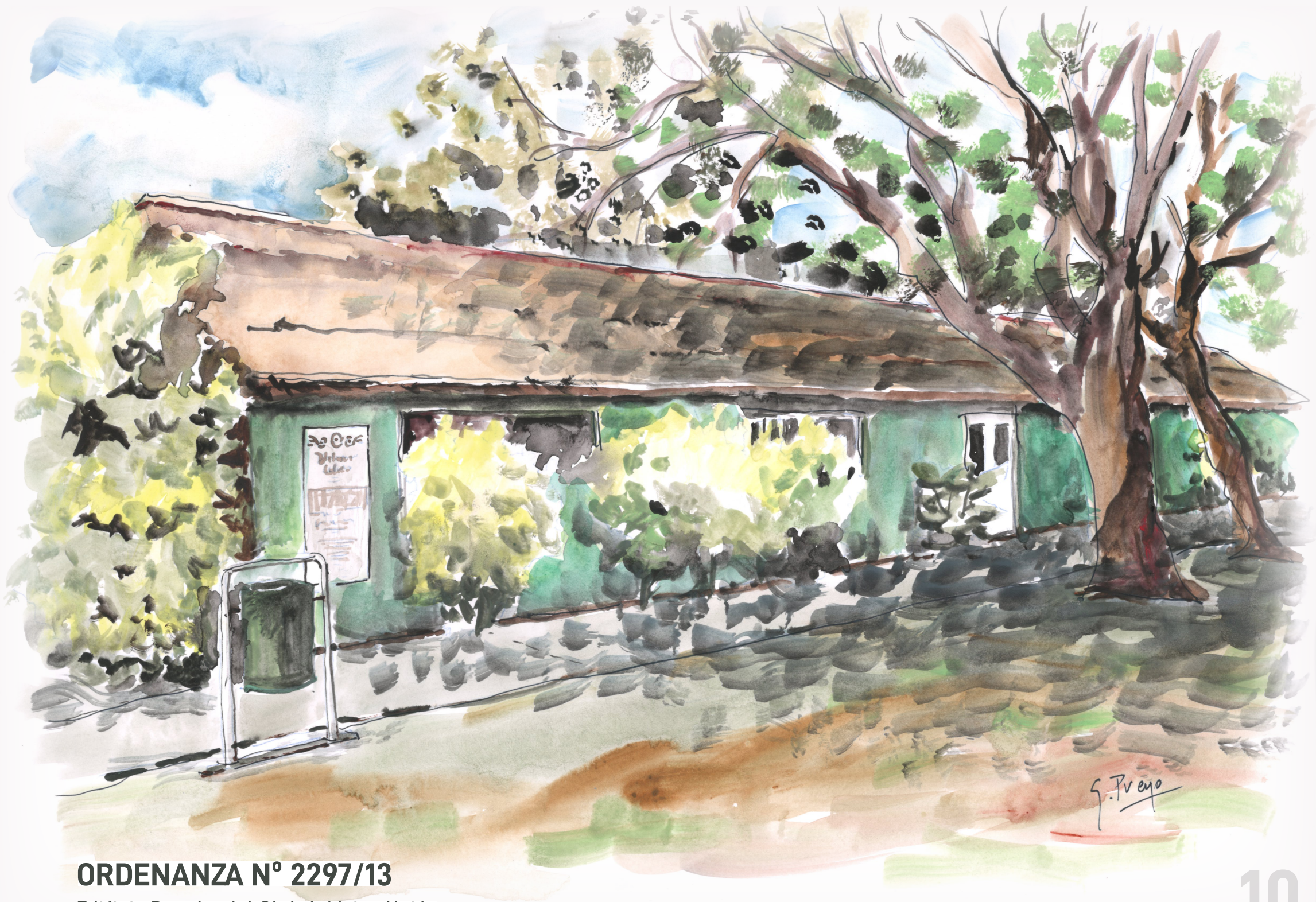
ORDENANZA N° 2297/13 Edificio Rancho del Club Atlético Unión