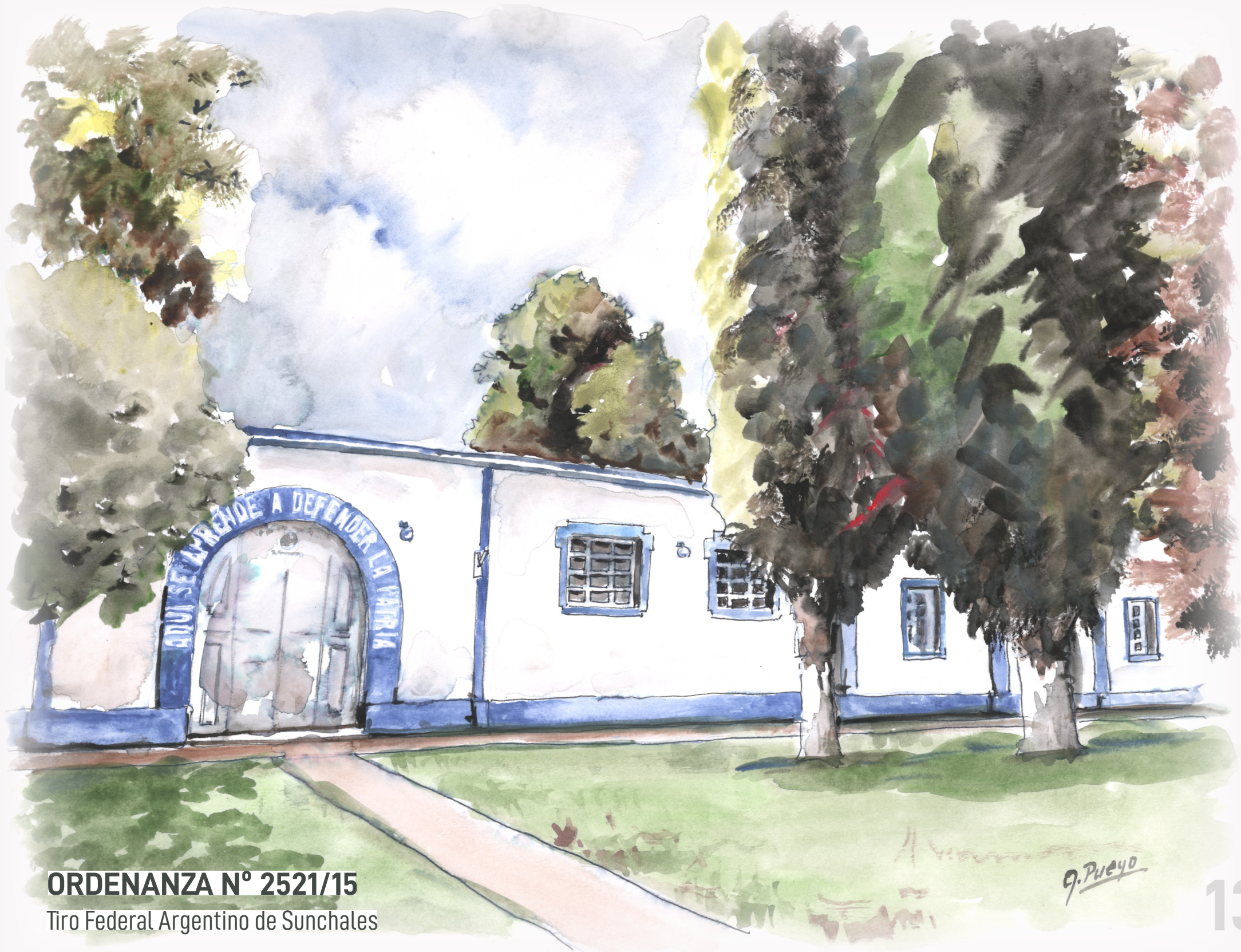
ORDENANZA N° 2521/15 Tiro Federal Argentino de Sunchales